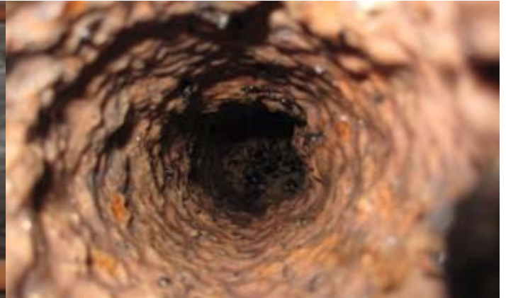
Visste du att vi har 1,5 mil avloppsledningar som nu har fått en välbehövlig genomgång